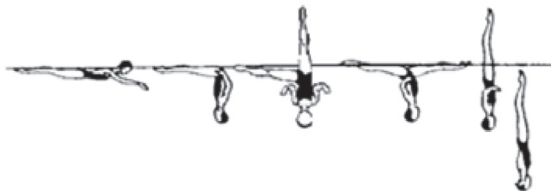
FIG 2 – 140 FLAMINGO POGRČENO KOLJENO (Flamingo Bent Knee, težina 2,4). Zauzima se osnovni položaj na leđima. Iz osnovnog položaja na leđima, kreće se u položaj pogrčenog koljena te položaj baletne noge pod pravim kutem u odnosu na površinu vode. Zauzima se položaj „Flaminga“. Noga podignuta u baletnu nogu zadržava svoju vertikalnu poziciju, kukovi se podižu dok se tijelo spušta, a pogrčena noga istovremeno zauzima položaj „vertikalnog pogrčenog koljena“. Pogrčena noga se ispruža do položaja vertikale. Slijedi vertikalni uron.

FIG 1 – 346 SIDE CRANE SPLIT (Side Fishtail Split, težina 2,0). Iz osnovnog položaja na prsima izvodi se front pike. Dok se tijelo rotira za 90 stupnjeva, istovremeno se jedna noga podiže u okomiti položaj do SIDE CRANE pozicije gdje se treba zadržati maksimalna visina u vrijeme simultane rotacije i podizanja noge. Slijedi rotacija tijela za još 90 stupnjeva dok se okomita noga spušta do SPLIT pozicije (špage). Nakon toga dolazi se do pozicije vertikale te se izvodi vertikalni uron.