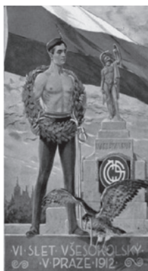
Slika 1. Vijenac sa srebrnim Monogramom 1912. [11]

Spomenuta postignuća zabilježena su nakon više od 80 godina od osvajanja gimnastičkih medalja u časopisu Hrvatskog olimpijskog odbora „Olimp“ riječima: „Tako Sušaku s velikim zakašnjenjem priznajemo prve osvojene medalje za hrvatski sport na olimpijskim igrama i svjetskom prvenstvu“ (Hemar, 2010).