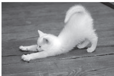
...mačke se znaju istezati ...