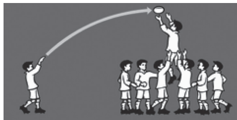
Slika 3. Formacija „Linijski aut”