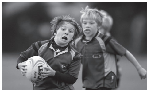
Slika 5. Ragbijaši dječje dobi

Verzija za djecu od 8 do 10 godine koji na smanjenom terenu igraju s 9 igrača u svakoj momčadi bez formacija linijskog auta i donjeg skupa , jer su djeca i dalje u dobi univerzalne sportske škole. Ali sudac više nema ulogu učitelja već samo kontrolora igre.