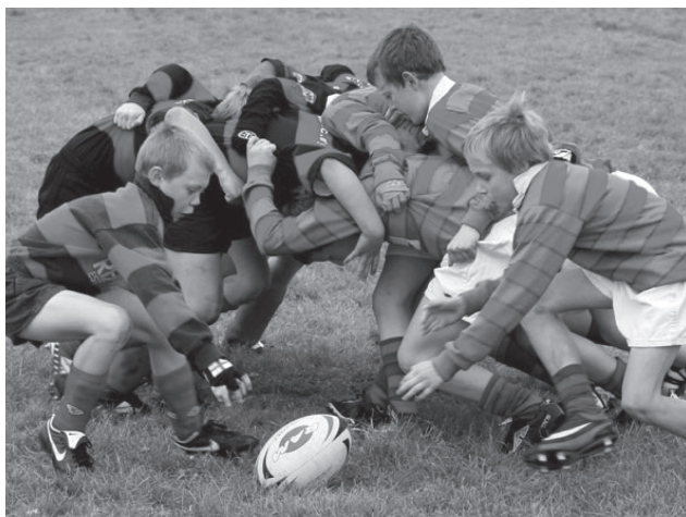
Slika 6. Donji skup mladih ragbijaša

Verzija za djecu od 10 do 12 godine koji na smanjenom terenu (60x40m) igraju s 10 igrača u svakoj momčadi te se prvi puta uvodi formacija donjeg skupa , ali ne formacija linijskog auta . Donjeg skupa je formiran od 3 igrača, ali je zabranjeno natjecanje za loptu već služi samo kao početak reseta igre. Ulaskom djece u osnovnu sportsku školu počinje temeljna sportska priprema pa se radi toga počinje sa zatvorenim formacijama donjeg skupa .