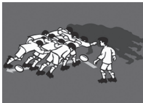
Slika 4. Formacija „Donji skup”